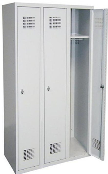
SUM-330 W (na obrázku 3-bodové uzamykání)

Metaltrend Slovakia, s.r.o. Tř. Maršála Malinovského 884, Sady 686 01 Uherské Hradiště Česká republika