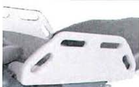
Boční díly levý a pravý, sklápěné, včetně rychloupínacího šroubu na normovanou kolejnici, 580x200 mm