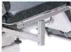
Držák monitoru z nerezové oceli, nesklopňný, včetně vysouvacího infuzního stojanu Ø 25mm