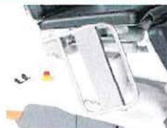
Boční díly levý a pravý, sklápěné, včetně uchycení, polstrované