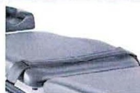
Tělový pás se suchým zipem, 2 dílný