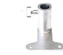
Upínací deska k opěrce zápěstí chirurga 30140000.