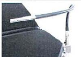
Ohebný držák chirurgického krytí s přívodem kyslíku (nezahrnuje upevňovací šroub 30900000)