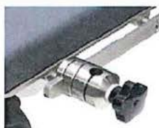
CNS připojovad šroub