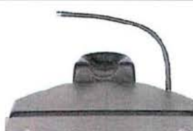
Ohebný držák chirurgického krytí (nezahrnuje upevňovací šroub 30900000)