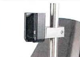
Držák dálkového ovládní z PVC k upevnění na infuzní stojan, Ø 25/18mm