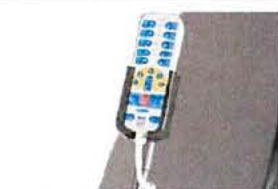
Držák dálkového ovládní z PVC