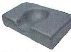
Polštář pro fixaci hlavy s dutinou (Rubinův polštář), 41x25cm, Výška 10cm