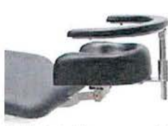
Opěrka zápěstí chirurga nastavitelná, včetně upínací desky 30130000. Sklápěná.