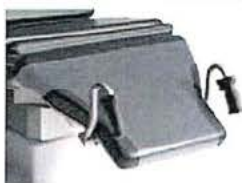
Ochranná folie - nožní část