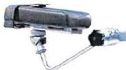
Polstrovaná područka s univerzálním kloubem s pásy pro upevnění předloktí