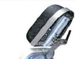
Nárazník hlavové části, nerezový.