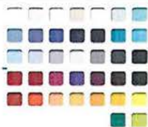
Volitelná barva polstrovaní dle vzorníku.