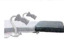
Připojitelný nožní díl, vč. normované kolejniče