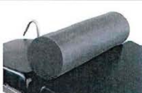
Plně válcový opěrný polštář, 50x15cm, PUD povrch