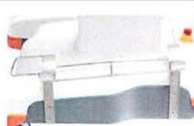
Držák kyslíkové lahve