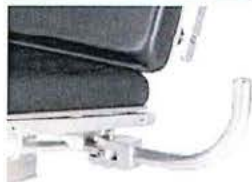
Držák monitoru z nerezové oceli, sklápňný, včetně vysouvacího infuzního stojanu Ø 25mm