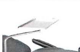
Nástrojový stolek 50x30x1.5cm, výškově nastavitelný, odpojitelňý