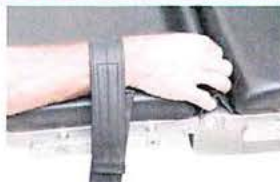
Pásy pro zajištění zápěstí. 1 pár