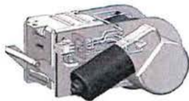
e-drive, přírůžka za motorický pojezd