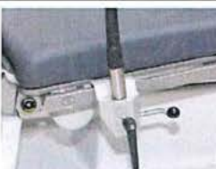
Držák pro upevnění na infuzní stojan Ø 25/18mm, PVC