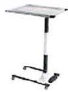
Nástrojový stolek „supportLine plus“ výškově nastavitelný