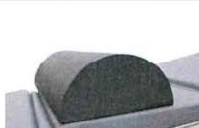
Půlválcový opěrný polštář, 60x28x14cm, PUD povrch