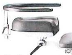
Opěrka zápěstí chirurga nastavitelná, včetně upínací desky 30130000.