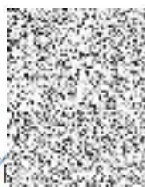
..... předseda odborné zkušební komise