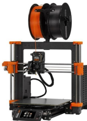
Ilustrační foto tiskárny

MK4 nabízí vysokorychlostní tisk, jednoduché ovládání a zároveň spolehlivost.