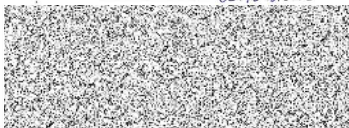
Bc. Michal Boudný příkazce