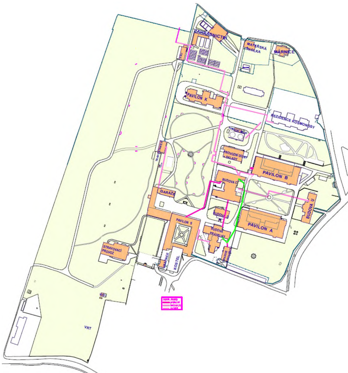
Obrázek 1: Situační plán areálu