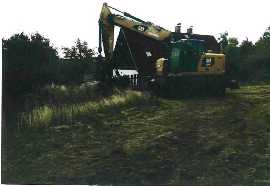
Foto č. 1 – Strojní zemní práce na SDD Margareta dne 4. 10. 2023