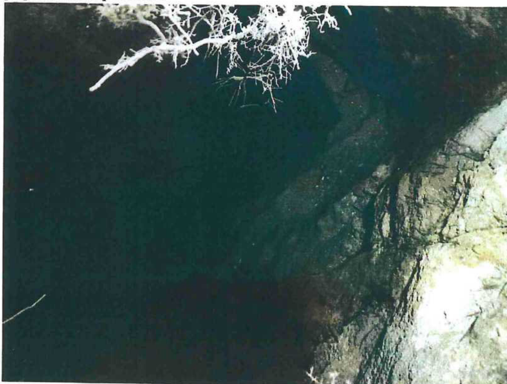
Foto č. 4 – Pohled do jámového stvolu dohledaného SDD Bartolomeus – dne 19. 9. 2023