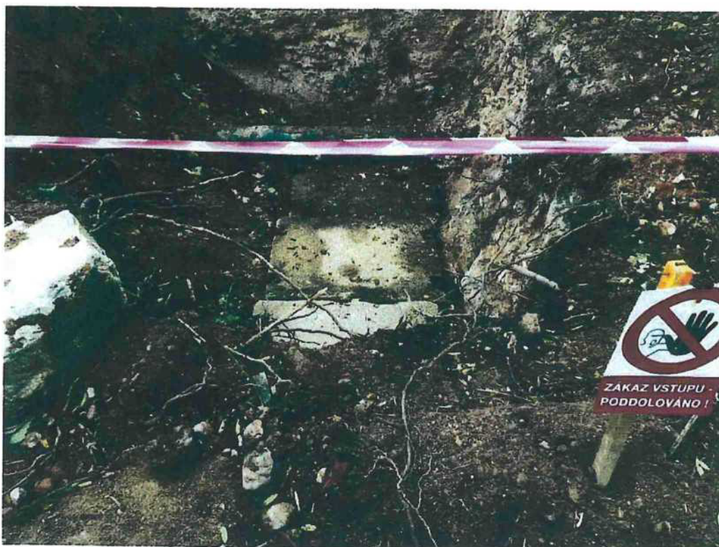
Foto č. 3 – Překrytí ohlubně jámy SDD Bartolomeus silničními panely (4. 10. 2023) po provedeném průzkumu