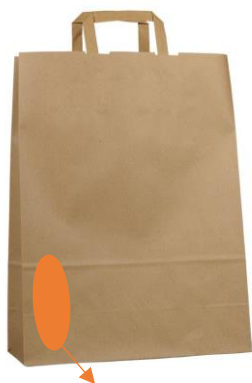
vánoční motiv + název společnosti

Dovoz objednaných předmětů do prostor/skladu PS, který se nachází v areálu Pod Šancemi na Praze 9, včetně doručení a zanášky do místa určeného společností. U skladu či budovy lze zaparkovat a sklad/místnost je v přízemí.