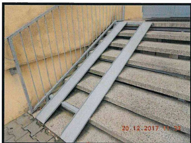
Obr. 6 - příklad nájezdová rampa a zábradlí v exteriéru