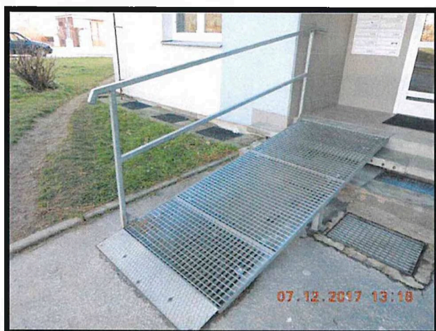
Obr. 7 – příklad zábradlí u vstupu do BD v exteriéru