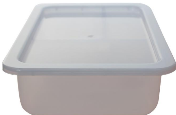
vrchní a čelní pohled z obou stran