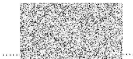
Razítko a podpis pořadatele