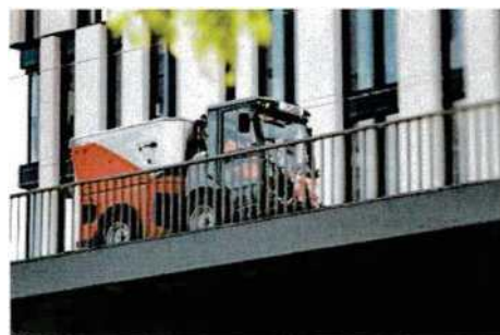
Flexibilní, bezpečný a plně komfortní