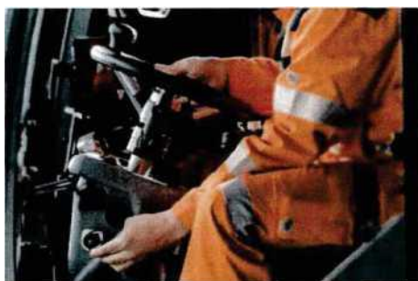
Ergonomie v každém detailu