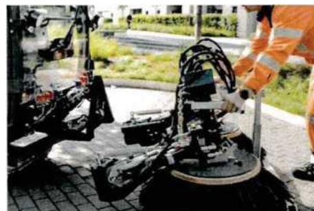
Celoroční využití, jednoduchý systém výměny