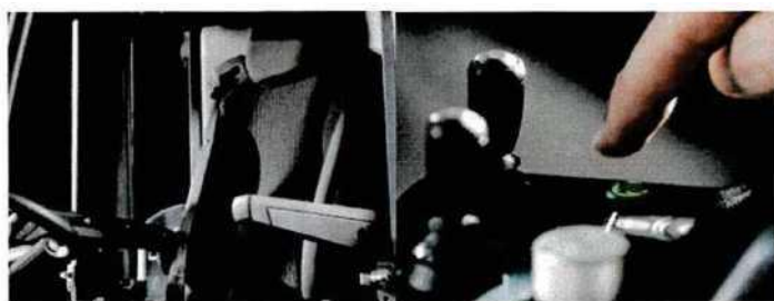
Vylepšená ergonomie, komfort obsluhy