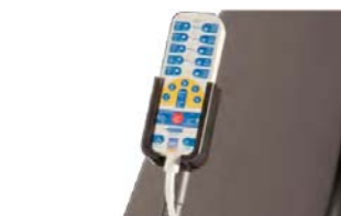
Držák dálkového ovládání z PVC