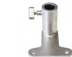
Upínací deska k opěrce zápěstí chirurga 30140000.