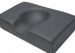
Polštář pro fixaci hlavy s dutinou (Rubinův polštář), 41x25cm, Výška 10cm