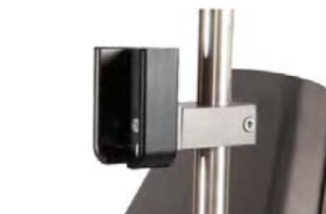
Držák dálkového ovládání z PVC k upevnění na infuzní stojan, Ø 25/18mm