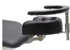
Opěrka zápěstí chirurga nastavitelná, včetně upínací desky 30130000. Sklopná.