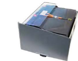
Zásuvka pro náhradní baterie vč. baterií