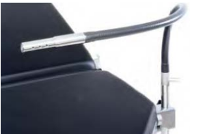
Ohebný držák chirurgického krytí s příívodem kyslíku (nezahrnuje upevňovací šroub 309000000)