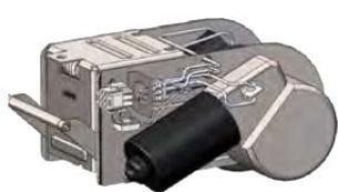
e-drive, přírážka za motorický pojezd