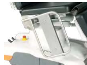
Boční díly levý a pravý, sklopné, včetně uchycení, polstrované