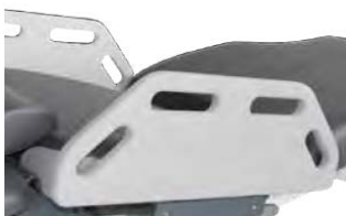
Boční díly levý a pravý, sklopné, včetně rychloupínacího šroubu na normovanou kolejniči, 580x200 mm