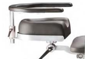
Opěrka zápěstí chirurga nastavitelná, včetně upínací desky 30130000.