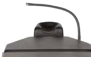
Ohebný držák chirurgického krytí (nezahrnuje upevňovací šroub 309000000)