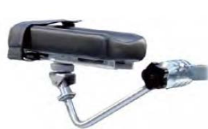
Polstrovaná područka s univerzálním kloubem s pásy pro upevnění předloktí