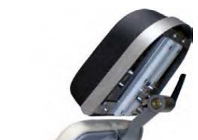
Nárazník hlavové části, nerezový.