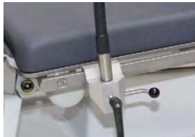
Držák pro upevnění na infuzní stojan Ø 25/18mm, PVC