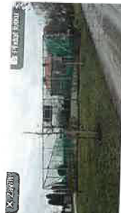
PANORAMA FOTKY 30 POKLEB