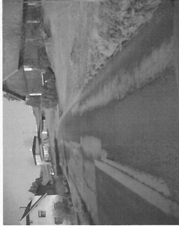
Silnice II/290 Roprachtice, rekonstrukce silnice