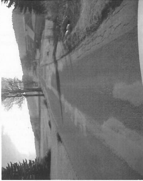
Silnice II/290 Roprachtice, rekonstrukce silnice