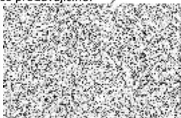
Vladimíra Hladká jednatelka

V Karviné – Ráji - 05. 10. 2023 - za prodávajícího: