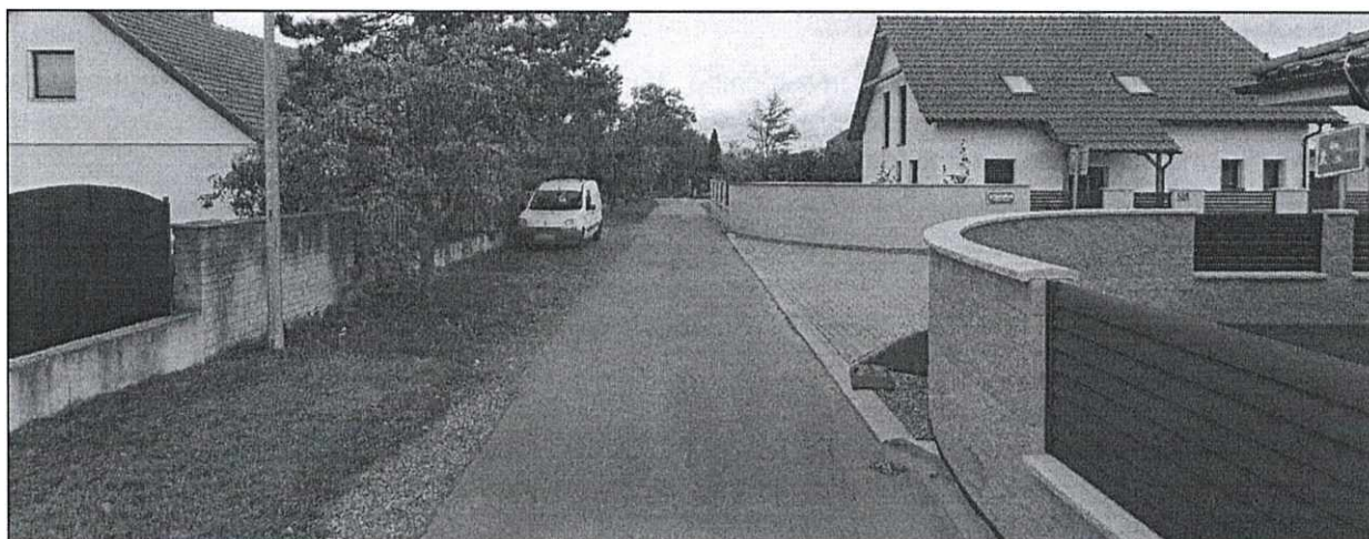
Obrázek 2 Panorama zájmové lokality