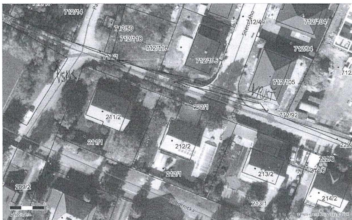
Obrázek 1 Zájmová lokalita