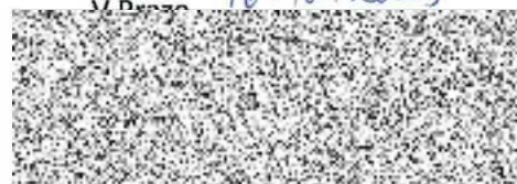
STUDENT AGENCY TRAVEL, K.S.