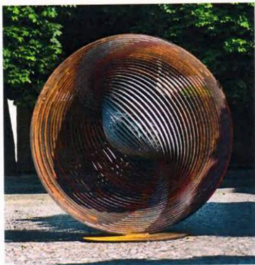
Příloha č. 1 – Vyobrazení uměleckého díla