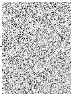
Ing. ... ja, ARSprojekt