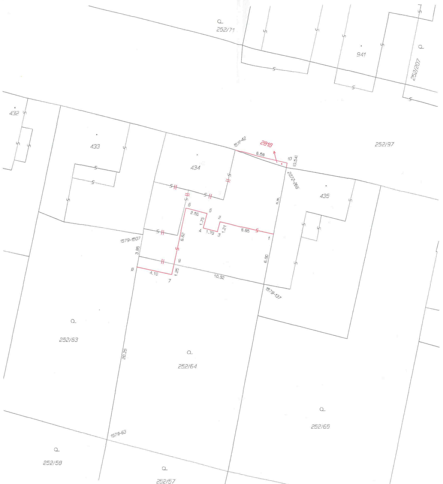
Seznam souřadnic (S-JTSK)