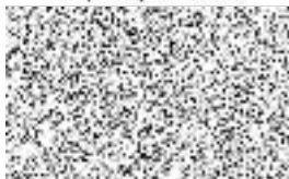
Radek Saska na základě plné moci