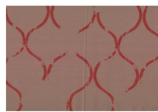
mat: Desira rub část přehozu u polštáře