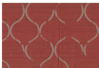
mat: Desira 33 líc pelmet, vrch přehozu, polštář