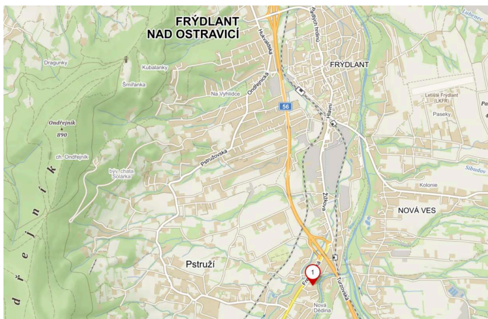
Obrázek 1 lokalizace stavby

Stavba se nachází v obci Frýdlant nad Ostravicí v lokalitě Nová Dědina, v okrese Frýdek - Místek v Moravskoslezském kraji.