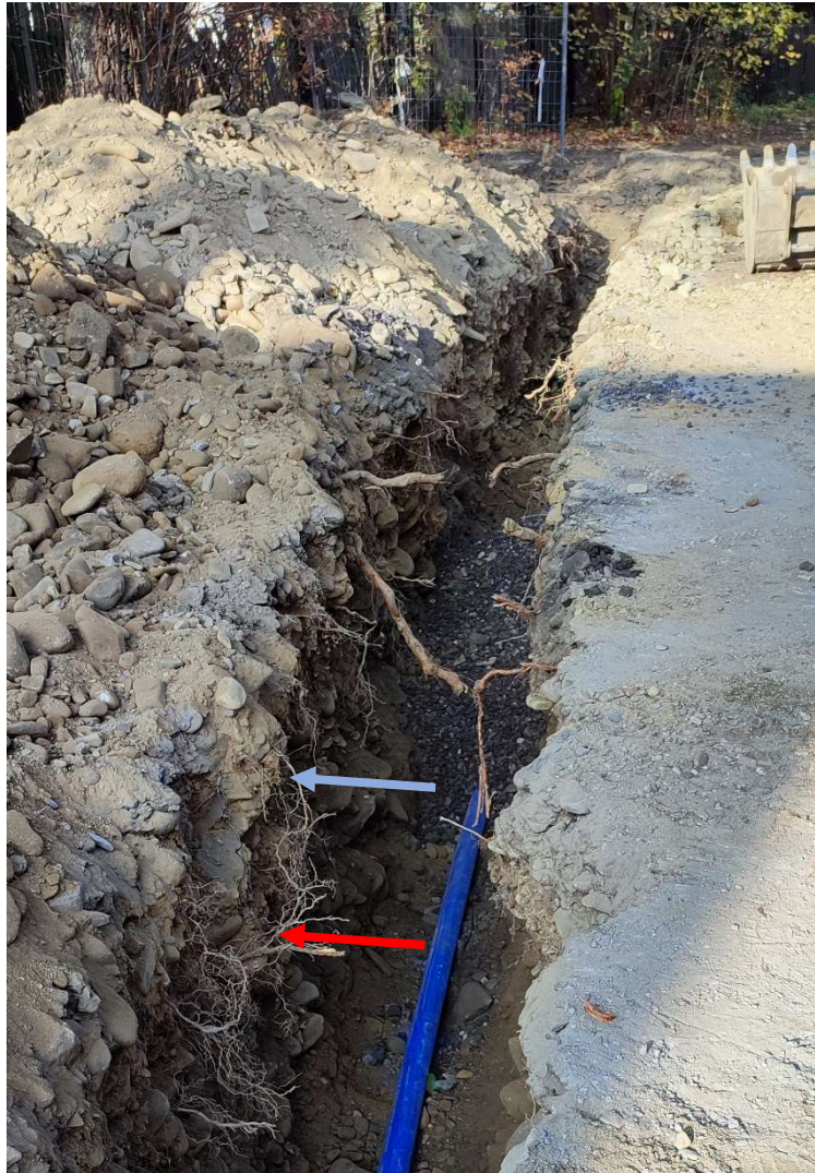
Obrázek 4 otevřený výkop se zaznačením jednotlivých typů zemin (zelená – tř. 2-3, modrá – tř. 4, červená – tř. 5)