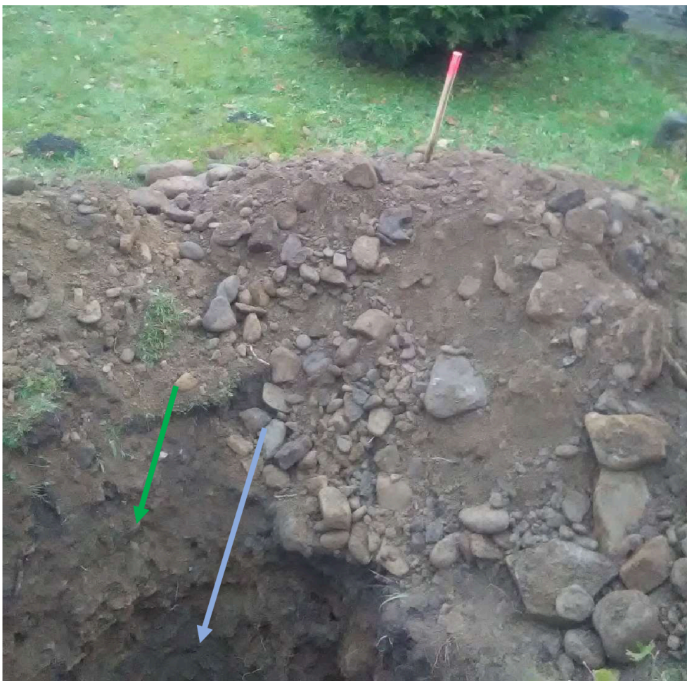
Obrázek 5 otevřený výkop se značením jednotlivých typů zemín (zelená – tř. 2-3, modrá – tř. 4, červená – tř. 5)