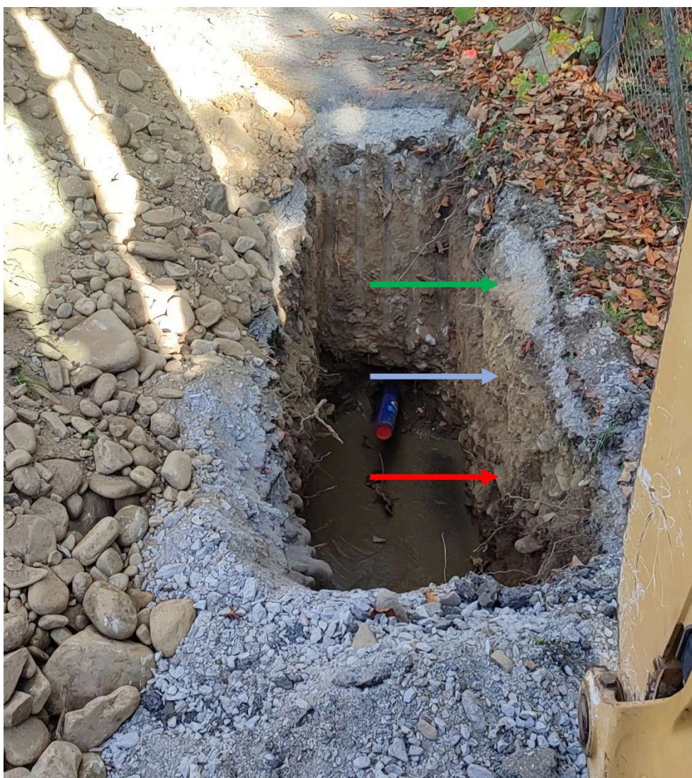
Obrázek 3 otevřený výkop se zaznačením jednotlivých typů zemin (zelená – tř. 2-3, modrá – tř. 4, červená – tř. 5)