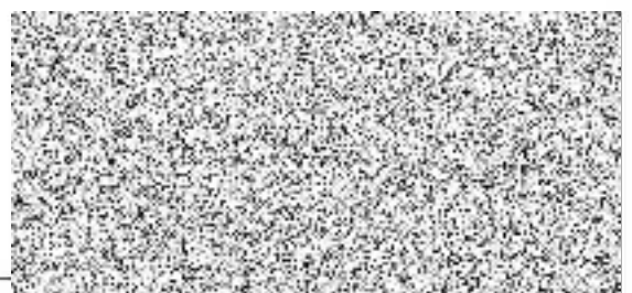
Město Valašské Meziříčí vedoucí odboru majetkové správy Budoucí povinný