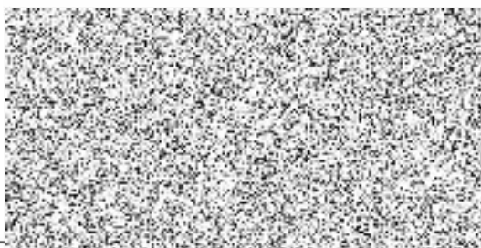
ČEZ Distribuce, a.s. na základě pověření ENPRO Energo s.r.o. Budoucí oprávněný