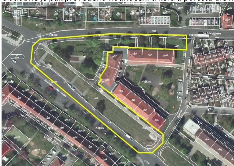
rozsah řešeného území

Na uvedené lokalitě bude zpracován kompletní dendrologický průzkum s návrhem péče či kácení. Hodnoceny budou nadzemní části dřevin, čili riziko poškození zlomem vzhledem k běžným klimatickým podmínkám (rychlost větru 32 m/s) bude posouzeno vizuálně (nezahrnuje takové zkoušky dřevin). V tabelární části je u stromů uveden obvod kmene stromu ve výšce 130 cm nad patou kmene, případně obvod na pařezu u kácených dřevin, průměr koruny, výška dřeviny, věkové stádium, zdravotní stav, fyziologická vitalita, stabilita, perspektiva, suché větve, sadovnická hodnota atd. Další specifika jednotlivých dřevin jsou popsána v poznámce. Dále je navrženo pěstební opatření a priorita zásahu. Obdobně je pak provedeno hodnocení u keřů a porostů dle metodik.