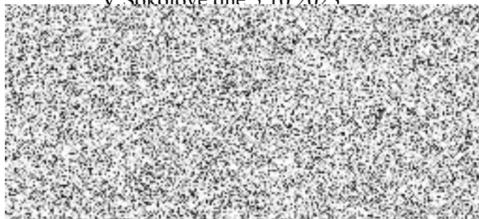
za prodávajícího Dagmar Kropáčková Taty jednatelka