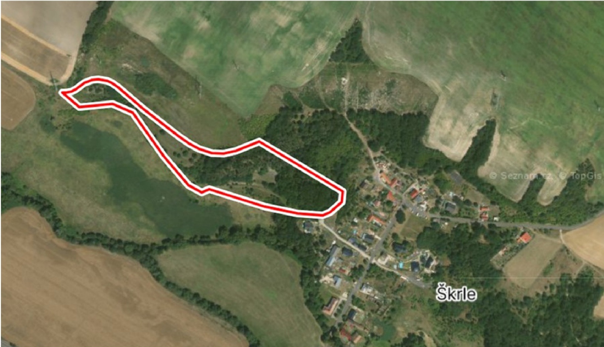
Příloha č. 4 – Mapa lokality