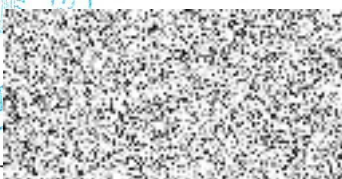
Bc. Jakub Brzoň vedoucí odboru majetkoprávního ÚMČ Praha 10