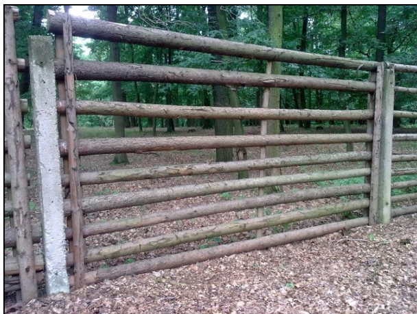
Obrázek 2: Tesový plot

V průběhu prací, kdy jsou stará plotová pole demontována, musí být pracoviště pod stálou kontrolou pracovníků, pohybujících se do vzdálenosti maximálně 30 m od porušeného oplocení. Při vzdálení se pracovníků na větší vzdálenost, při krátkodobém opuštění pracoviště během pracovní směny a při opuštění pracoviště po ukončení pracovní směny musí být vzniklé prostupy vždy, důsledně a pevně zajištěny proti úniku zvěře (např. oborním pletivem s optickými zábranami – tesy) tak, aby v žádném místě nevznikla mezera širší než 15 cm. Tento požadavek bude přísně kontrolován, smluvní pokuta za porušení bude specifikována ve smlouvě o provedení díla. Oborní brány budou otevřeny pouze při průjezdu vozidel nebo techniky a brány se zámky budou trvale uzamčeny (i během dne). Pracovníci dodavatele se budou po oborním objektu pohybovat pouze v místě prováděných prací a to v čase a po trasách předem dohodnutých s pověřeným pracovníkem investora.