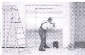
Servis 24 hodin