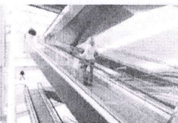
Eskalátory & pohyblivé chodníky