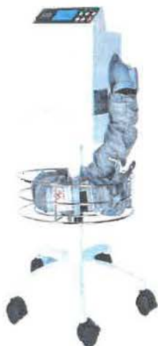
Obr: IOB - ilustrační foto