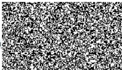
starosta Města Nechanice