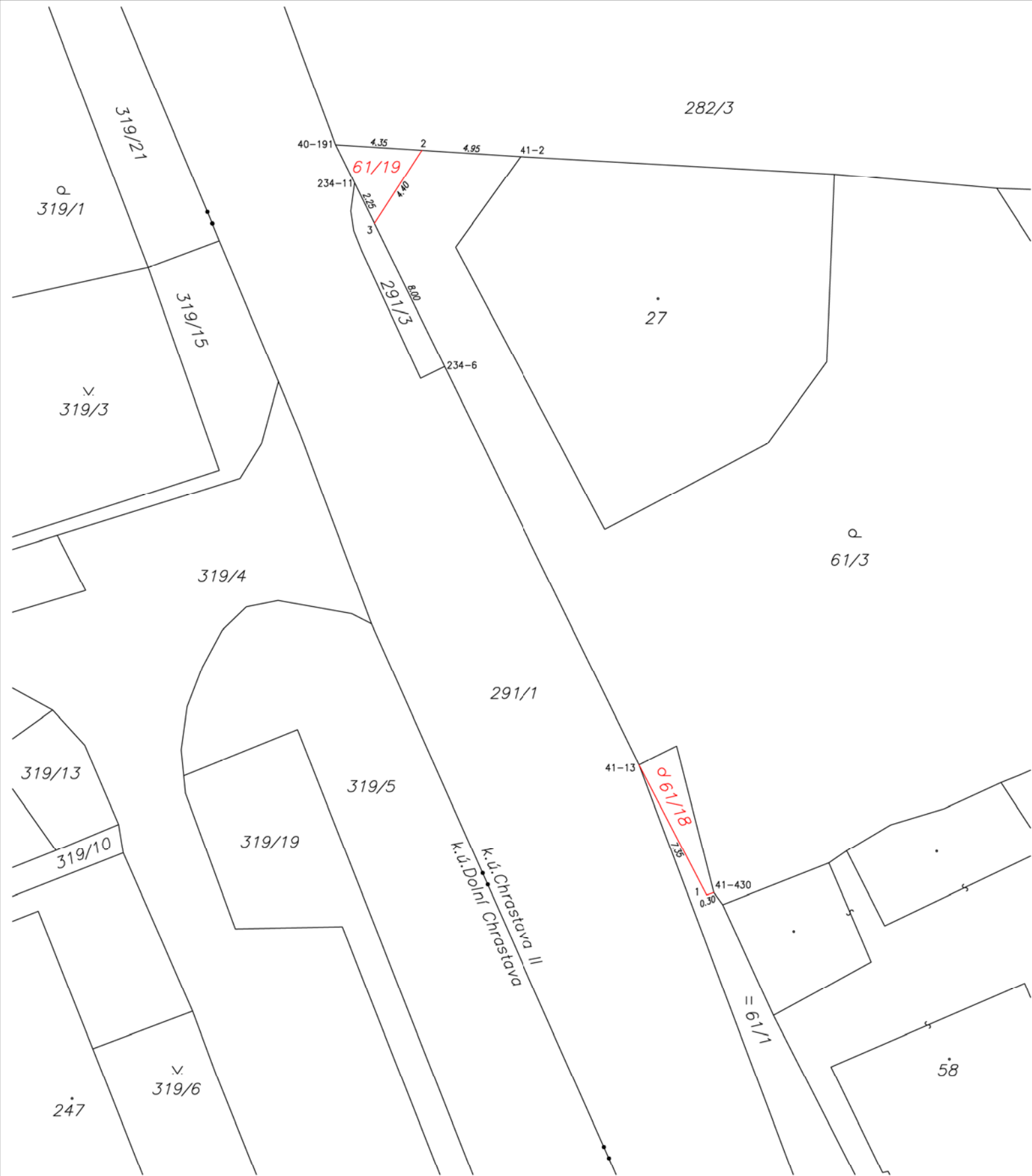
Seznam souřadnic (S-JTSK)