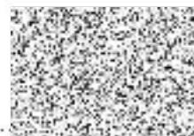
za Zhotovitele – razítko a podpis