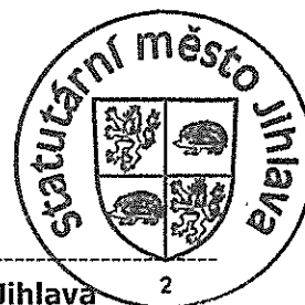
Statutární město Jihlava Ing. Vratislav Výborný