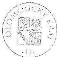
Olomoucký kraj Mgr. Jiří Zemánek 1. náměstek hejtmána