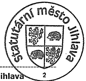
Statutární město Jihlava Ing. Vratislav Výborný