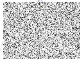
Archa, z.s. Praha 5