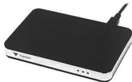
programovací stolní čtečka