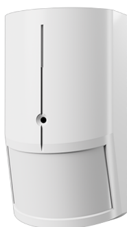
JA-180PB je kombinací detektoru pohybu JA-180P PIR a detektoru rozbití skla v jednom zařízení. Každý detektor komunikuje s ústřednou jako samostatné zařízení.