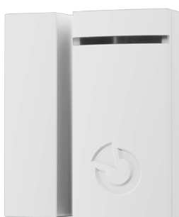
Detektor JA-151M je určen k detekci otevření okna nebo dveří. Má jedinečný malý rozměr. Je vhodný pro obytné i komerční prostory.