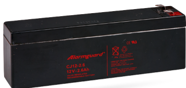
Bezúdržbový zálohovací akumulátor 12 V/2,6 Ah.