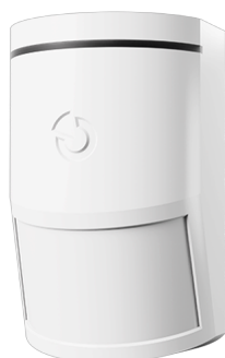
JA-110P je sběrníkový detektor pohybu PIR určený pro ochranu interiérů prostřednictvím infrapasivní detekce pohybu v místnosti. Charakteristiky detekce lze optimalizovat pomocí výměnných čoček.