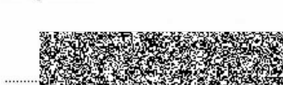
plk. M. náměstek