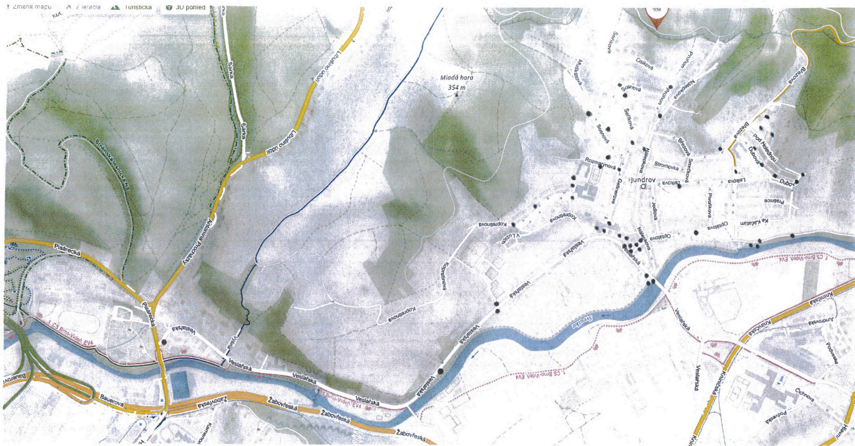
Zákres stanovišť odpadkových košů k příloze č. 3 Celkem 51 kusů odpadkových košů