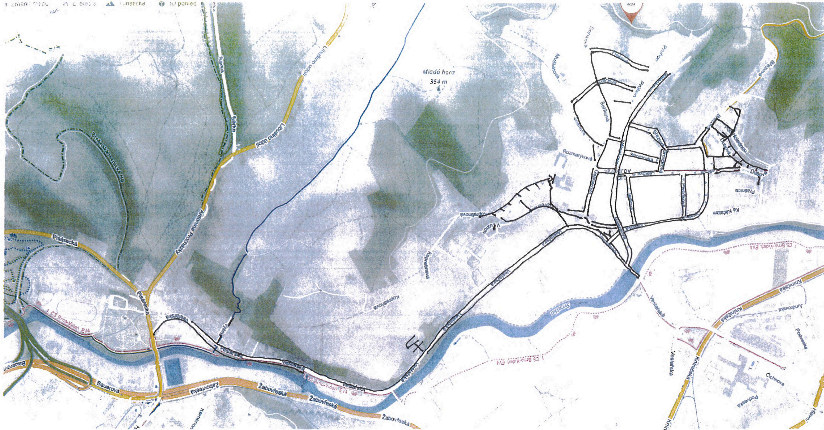
Zákres chodníků k údržbě k příloze č. 1