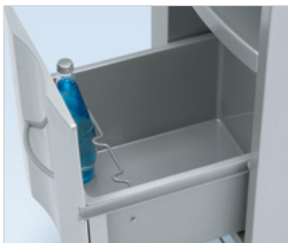
Spodní velká zásuvka je vybavena praktickým držákem lahví.