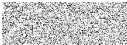
Rudolf Zouhar Montáže inženýrských sítí, spol. s r. o.

S předloženou cenovou nabídkou na realizaci rekonstrukce regulace tlaku plynu s výměnou RTP na provozovaném plynovém zařízení OPZ a výměnou uzávěru HUP, včetně souvisejících prací dle soupisu prací, který je přílohou této CN a podmínek splatnosti faktury, souhlasíme.