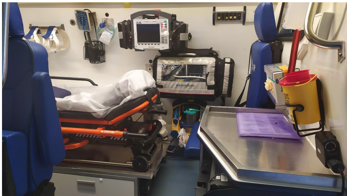
ilustrační foto č. 1