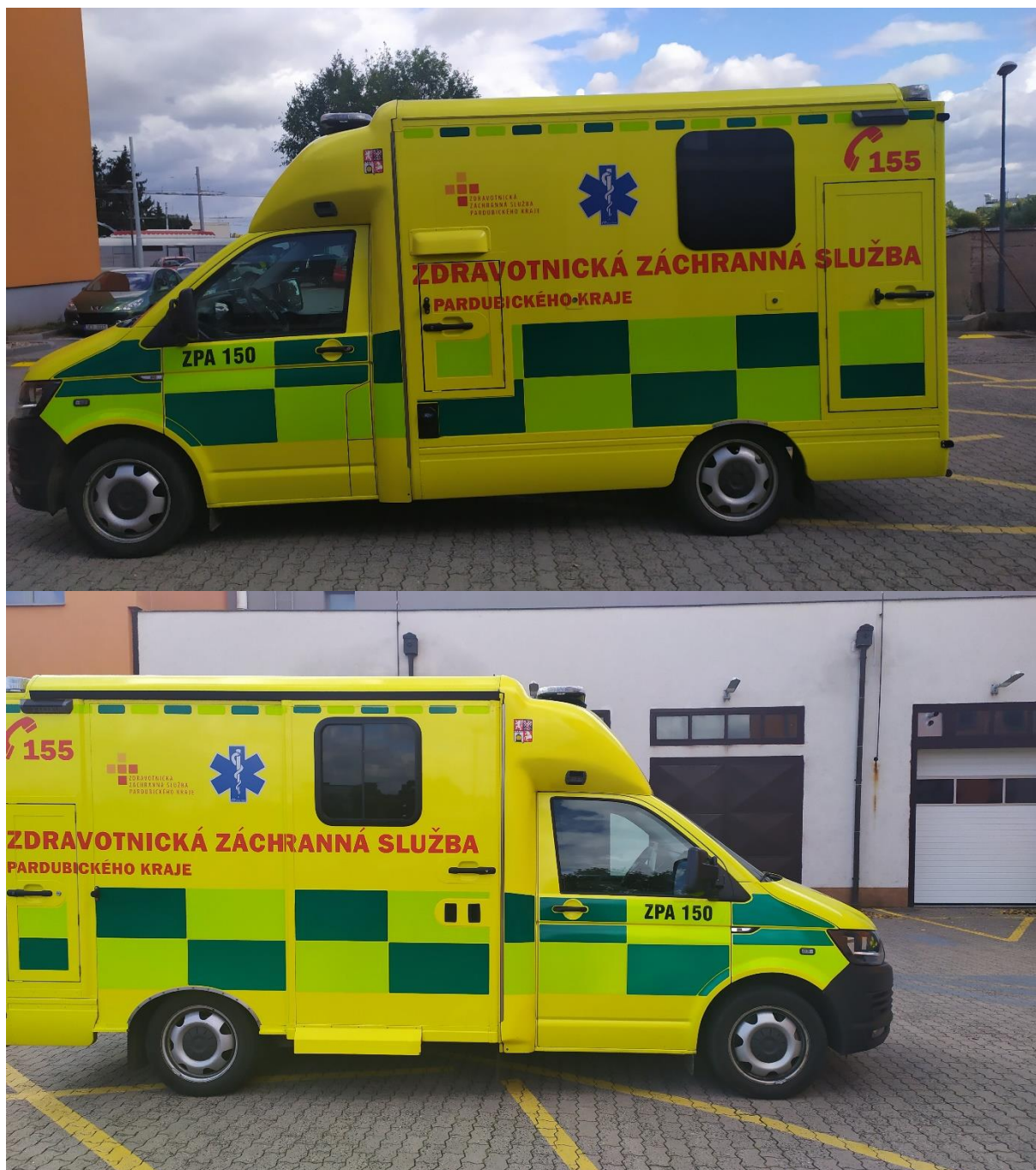
Ilustrační fotografie č. 1