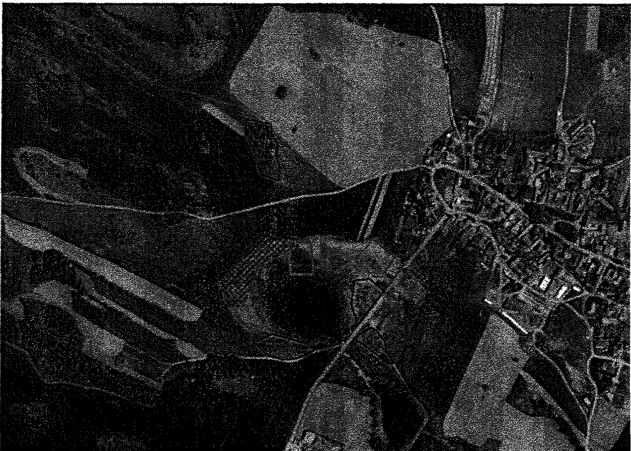
červeně – pastva ovcí v oplůtku modře – stržení drnu v litorálu rybníka oranžově – kosení břehových porostů