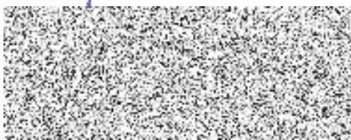
brig. gen. Ing. Miloš Svatoš ředitel HZS Středočeského kraje vrchní rada

Česká republika Hasičský záchranný sbor Středočeského kraje Jana Palacha 1970 272 01 Kladno 2