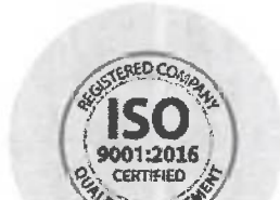
Certifikát ISO 9001:2016

Potvrzení Technické inspekce ČR - Organizace státního odborného dozoru.