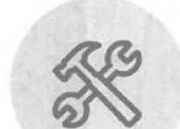
Certifikát Projektového managementu

Osvědčení výhradního, autorizovaného distributora pro Prahu a SČ kraj.