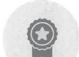
Certifikát Autorizovaného distributora LC

Osvědčení úspěšné implementace postupů v Systému managementu kvality práce.