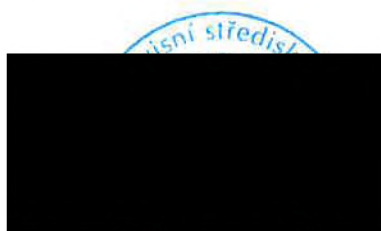
ředitel Servisního střediska